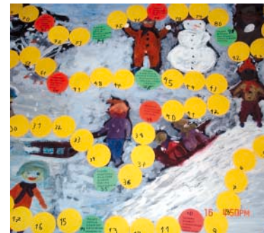
Materiały Happy House