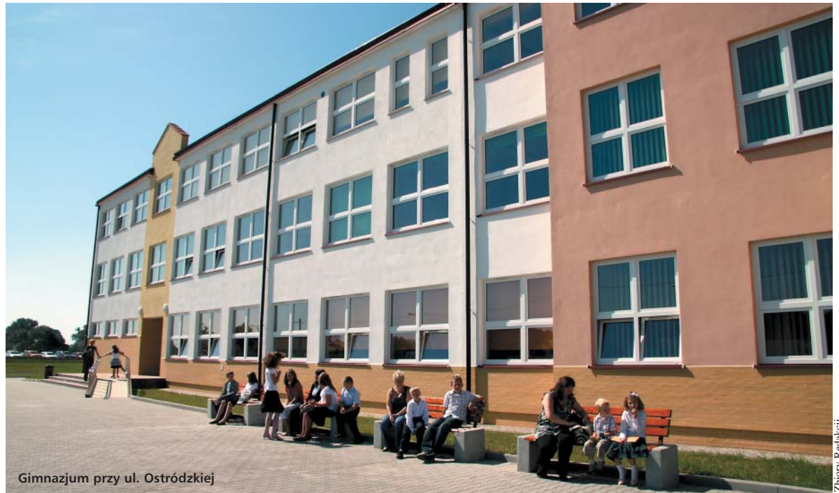
Gimnazjum przy ul. Ostródzkiej

zostało 11 milionów przeznaczonych zostanie na inwestycje. W 2010 r. zakończone zostaną prace przy budowie ulic Nowodworskiej i Odkrytej oraz modernizacja układu komunikacyjnego Ruskowy Bród – Zdziarska – Berensona. Przewidziane jest również zakończenie budowy ronda Małej Brzozy przy ul. Głębockiej, o którym piszemy w tym numerze „Czasu Białoleki”. Inną ważną inwestycją dla Białoleki, która pochłonie w tym roku 400 tys. zł jest budowa nowych ścieżek rowerowych.