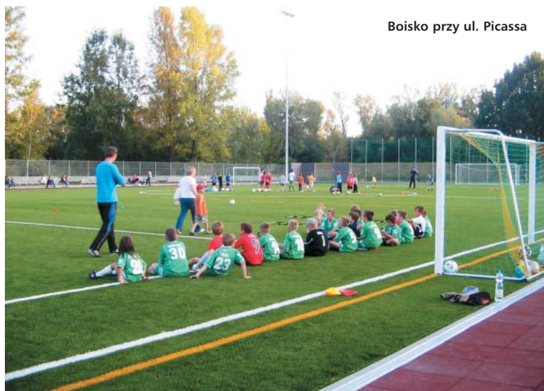
Boisko przy ul. Picassa

Dzięki inwestycjom zrealizowanym przez dzielnicę i miasto Białoleka zmienia się nie do poznania. DN, BWN