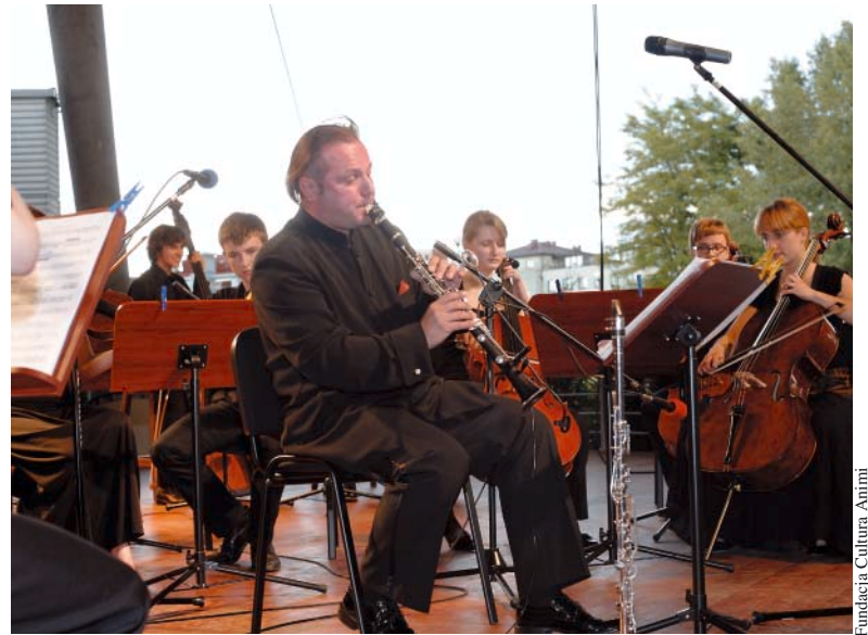
Fundacja Cultura Animi

perfekcyjną interpretacją. Zarówno melomani jak i ci, którzy zetkną się z tym artystą po raz pierwszy mają gwarancję usłyszenia dobrej muzyki.