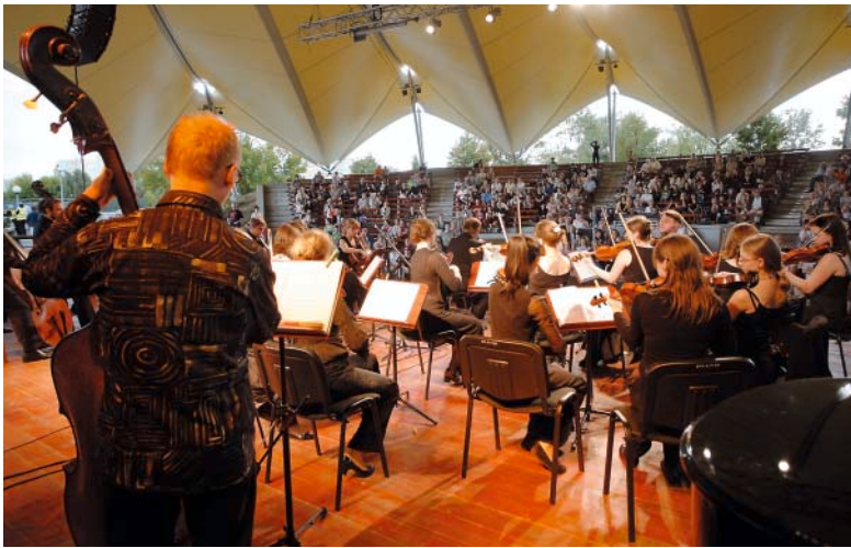
Fundacja Cultura Animi